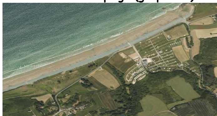
vue aérienne de la plage (géoportail)

Activités pratiquées: Baignade, char à voile, kayak de mer