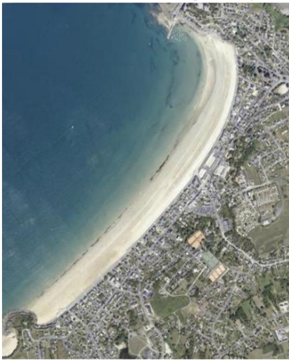
vue aérienne de la plage

Activités pratiquées: Baignade, pêche à pied, kayak de mer